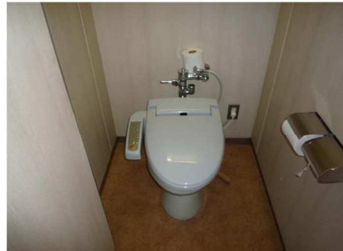
女性トイレ（改修前）：大便器スペース

トイレに合わせてEVホール・共用廊下の内装更新、照明のLED化を実施。トイレと隣接しているため全体的な雰囲気を含めながらイメージを一新しました。