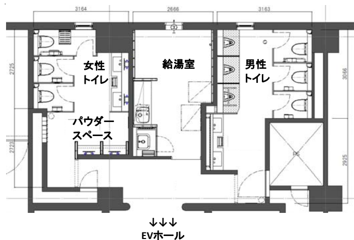
基準階トイレ平面図

トイレのレイアウト変更は行わず、器具・内装を更新・女性配慮を充実することで建物の付加価値を高めました。