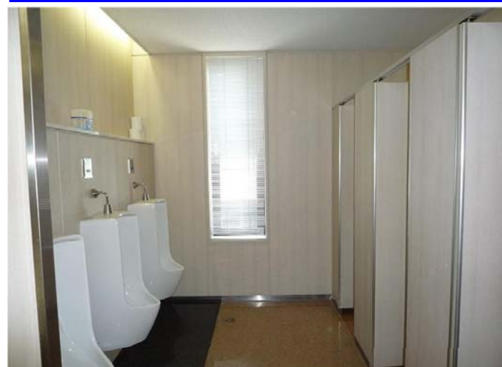
男性トイレ（改修前）：小便器スペース

女性のお化粧時の配慮として、間接照明付の鏡を設置しました。手洗スペースはツインデッキカウンターの採用で荷物置きに配慮。パウダークォーターは天井までの仕切り板を設置し、個室感を高めました。