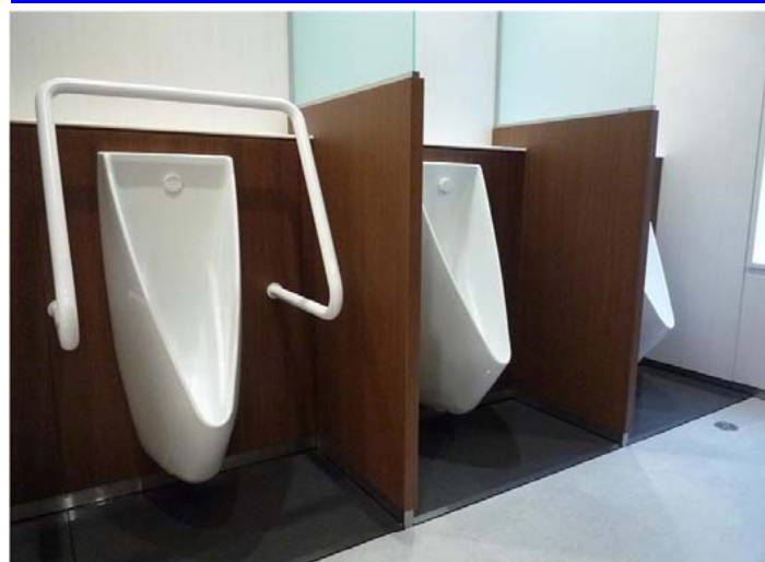
男性トイレ（改修後）：小便器スペース

デザイン性・節水性に優れたマイクロ波センサー内蔵の壁掛け小便器・アイテム01を設置。仕切り板を天井まで伸ばすことで個室感を演出しました。ライニングも低くなったので、荷物をラクに置くことができます。