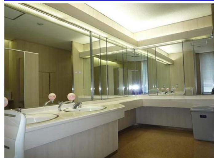
女性トイレ（改修前）：パウダースペース

ドライエリアがないため、荷物を置く場所に少し困ります。全面鏡のため、空間は広く感じますが他の利用者の鏡の映り込みが気になります。