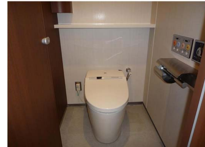
女性トイレ（改修後）：大便器スペース

大便器は、ネオレストを設置。タンクレスなので、スッキリとした印象を与えます。また、棚を設置することにより安心して物が置けるよう配慮しました。