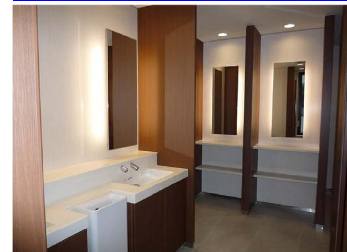
女性トイレ（改修後）：パウダースペース

女性のお化粧時の配慮として、間接照明付の鏡を設置しました。手洗スペースはツインデッキカウンターの採用で荷物置きに配慮。パウダークォーターは天井までの仕切り板を設置し、個室感を高めました。