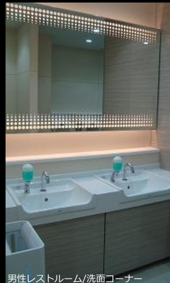
男性レストルーム/洗面コーナー