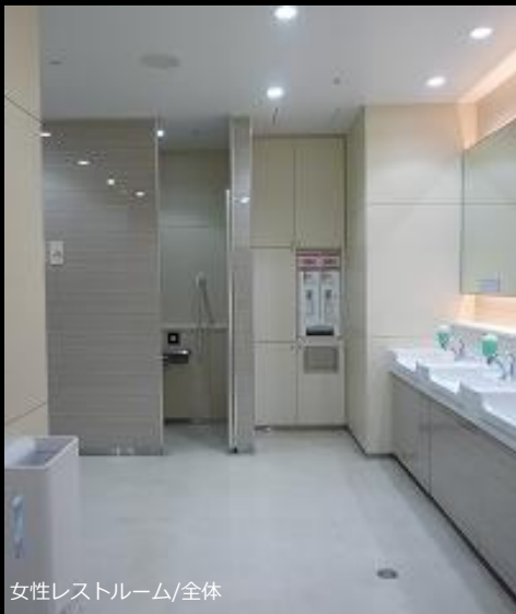
女性レストルーム/全体