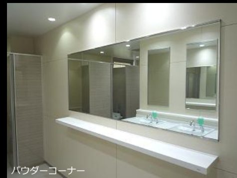
パウダーコーナー