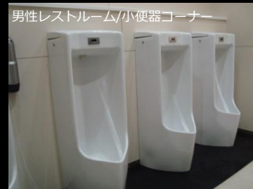
男性レストルーム/小便器コーナー

小便器足元にはハイドロセラ・フロアPUを使用し、菌の繁殖と清掃性の向上を図っている。