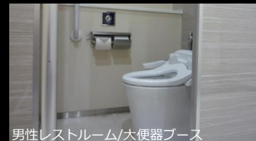
男性レストルーム/大便器ブース

小便器足元にはハイドロセラ・フロアPUを使用し、菌の繁殖と清掃性の向上を図っている。