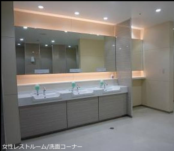
女性レストルーム/洗面コーナー

ブース内には買い物済ませたお客様に配慮し、荷物を置けるライニングや荷物掛、コート掛のフックを設置。高齢者配慮も考え、手すりも設置している。