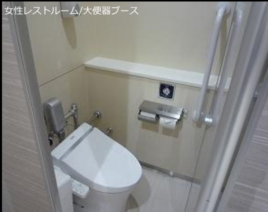
女性レストルーム/大便器ブース

床の色を廊下と近似色にすることにより、売り場からの連続性を表現。壁はやわらかみのある明るい木目を使用し、ブースは鏡面仕様にすることで清潔感と高級感を持たせた。