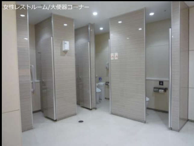
女性レストルーム/大便器コーナー

床の色を廊下と近似色にすることにより、売り場からの連続性を表現。壁はやわらかみのある明るい木目を使用し、ブースは鏡面仕様にすることで清潔感と高級感を持たせた。