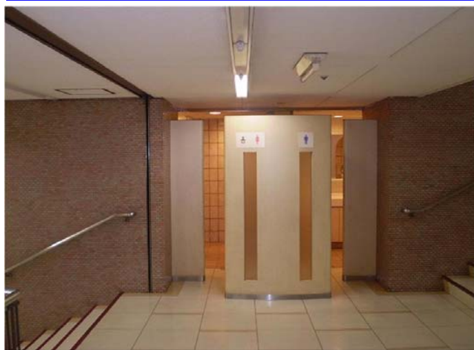
既存の階段室壁面とトイレ入り口。レンガ調のタイルは老朽化と共に、少し暗いイメージがあった。