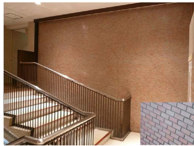
K・H階段室共に、既存の壁には50×25のレンガ調のタイルが貼られていた。