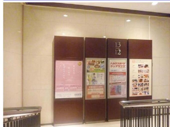
既設のサインボードも活かしながら、壁パネルを加工して納めている。