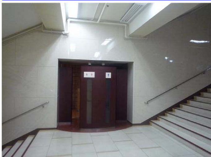
トイレ入り口は濃い木目としてコントラストを付け、わかりやすく、すっきりと仕上している。