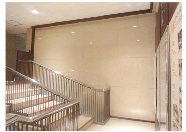
既設の手すりを残しながら、壁パネルに切欠きを入れることで納めている。