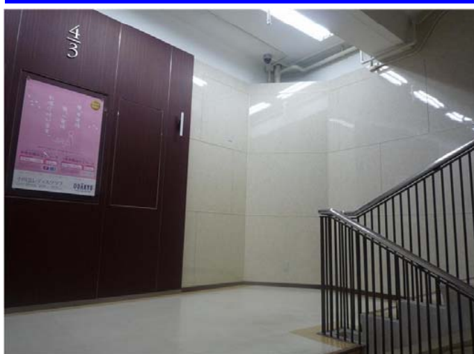
壁際上部の設備配管と防犯カメラを残しながら、手前に新規に壁を設けた。