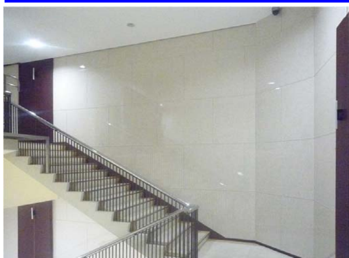
壁をホワイト系にした事により、階段室全体が明るくなった。