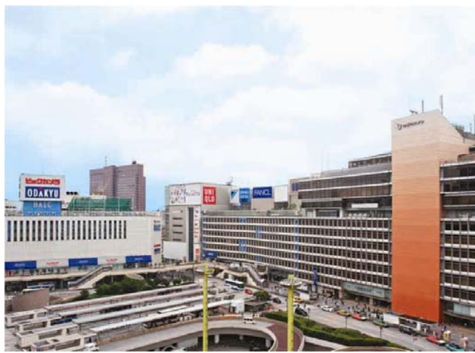
新宿駅西口に有る小田急百貨店の旗艦店舗