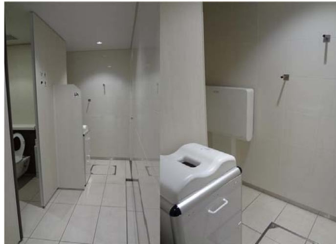
お子様連れのお客様に配慮し、ベビーシート・おむつ用ダストボックスを完備したおむつ替えコーナーを設置した。