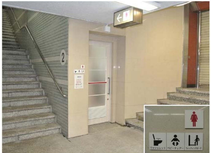
名古屋駅前、桜通りの昭和45年創業になる地下街。