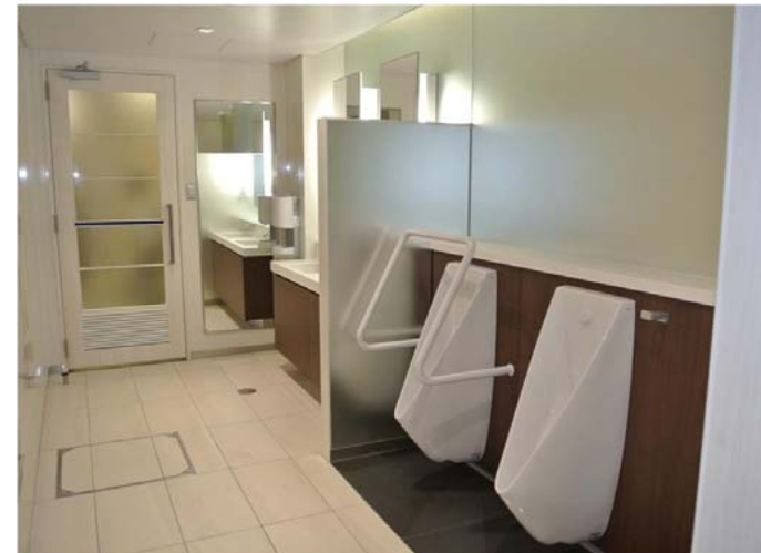
小便器ラインングにスリット状の吸気口を設置。壁を経由し、天井内で強制排気用ダクトに接続することで、小便器汚垂石まわりの臭気を除去している。