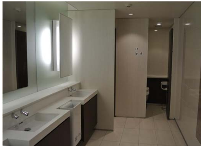
くつろげる雰囲気を目指し、『自然』をトイレ空間に埋め込んだ。内装タイル(床・壁)はページュ系で“土素材”を表現。また、ブース扉や一部面材には“木質素材”プリントを使用。