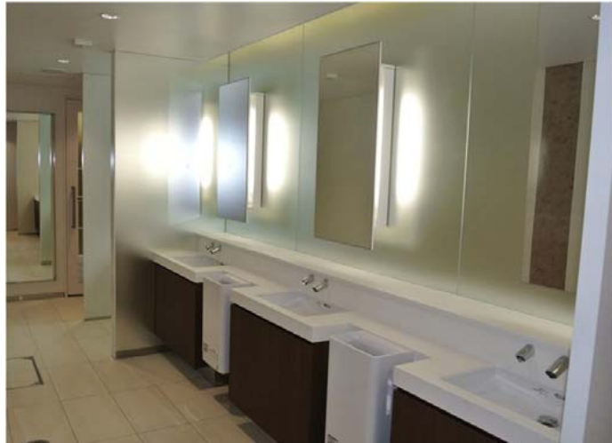
照明はお化粧直しに配慮した色温度と波長を再現する“美光色”器具を採用。非接触で利用できる自動水栓やクリーンドライを選定するなど、快適性を高めている。