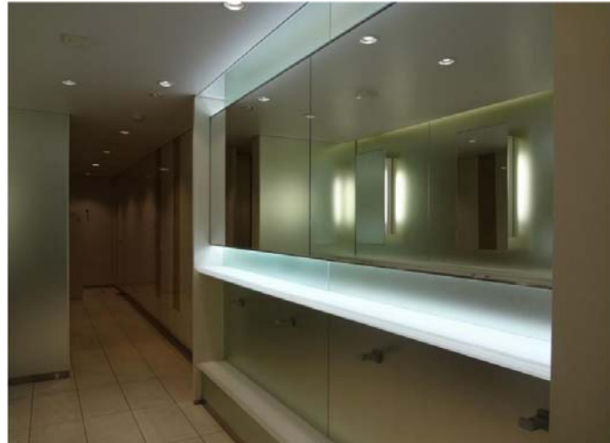
洗面・パウダーコーナーには、淡いグリーンカラーのミラーガラスの採用と間接照明で、『キラキラする森林の木漏れ日』を表現した。