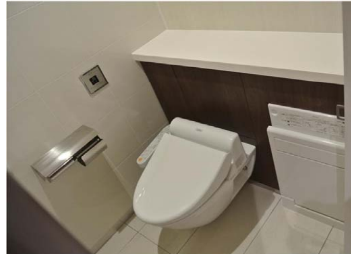
奥行きが広いラインングを設け、荷物置きに配慮している。女性トイレだけでなく、男性トイレにもフィッティングボードを設置したブースを設けている。