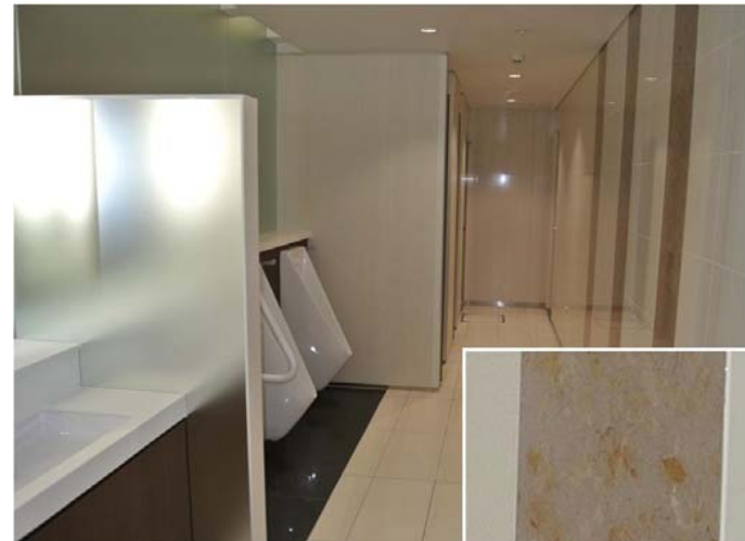
壁の一部には本物の木の葉をアクリルで固めたパネルを採用。テーマカラーの「自然」を強調している。