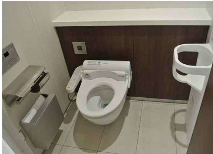
清掃性に配慮し、器具は全て壁掛けタイプに変更。ベビーチェアや手すり、フィッティングボード等も設置し、様々な利用者に配慮した。